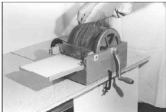
Abb. 4: Handkardier- maschine GS 1