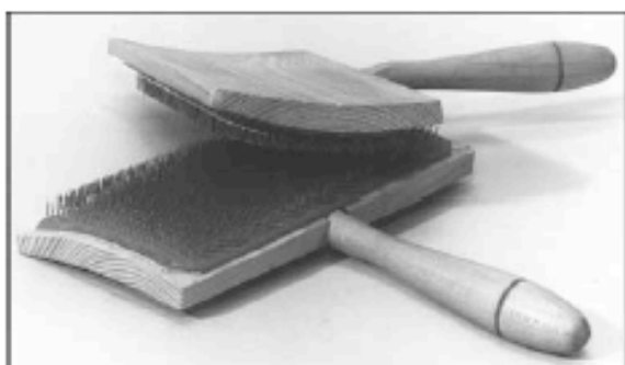
Abb. 2: Handkarden