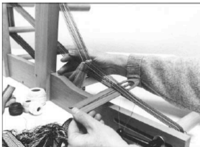
Abb. 1: Inkle-loom