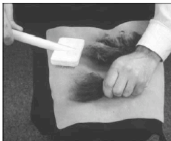
Abb. 3: Mini-Handkarde mit Lederunterlage